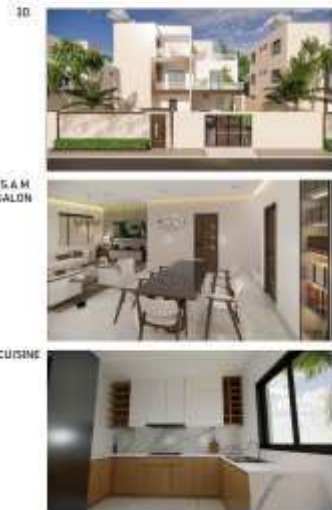
IMAGES 3D/ INTERIEUR