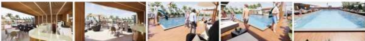
COMPLEXE SPORTIVE ET COMMERCIAL