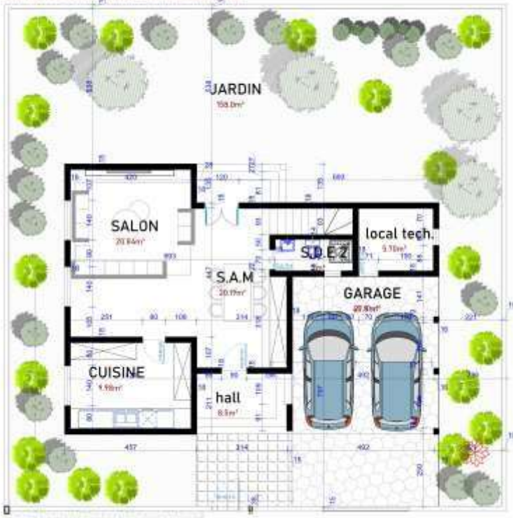
VUE EN PLAN 000/ TABLEAU DE SURFACE