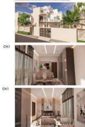
IMAGES 3D/ INTERIEUR