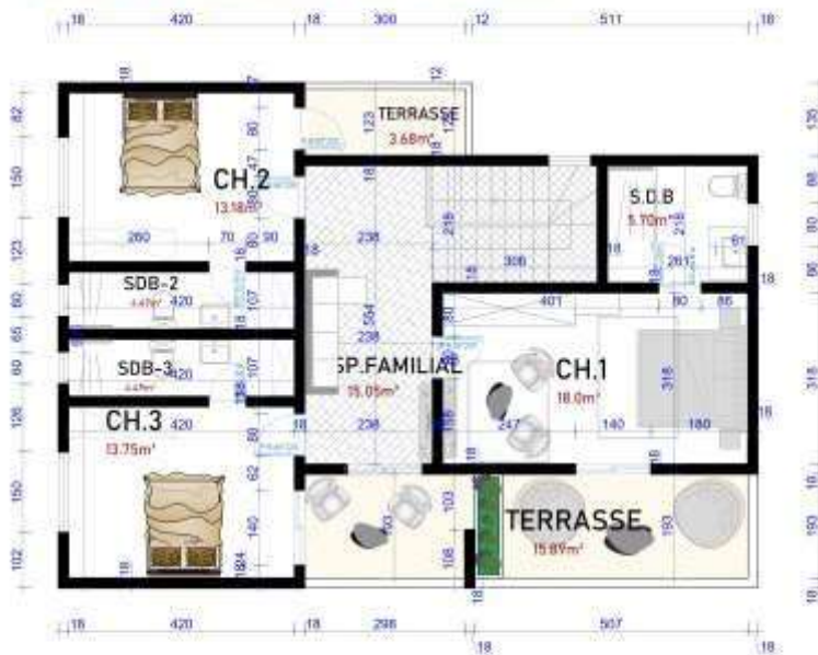
VUE EN PLAN ETAGE 01/ TABLEAU DE SURFACE